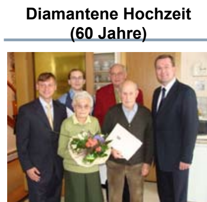
Diamantene Hochzeit (60 Jahre)