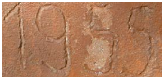
Nr. 2 (1955)