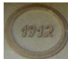
Nr. 5 (1912)