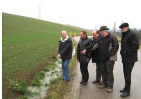
Foto: Begehung der Landesregierung

Vor allem durch die zwei großen Projekte in Kogl und Sieghartskirchen von Sichelgrund bis Gratschwein wird man durch die geplanten baulichen Veränderungen eine Verbesserung der Situation herbeiführen.