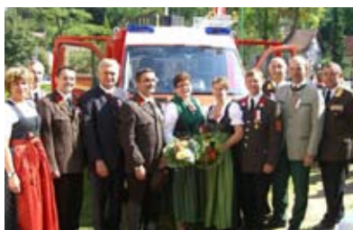
Am 06.09. wurde das neue Löschfahrzeug der FF Kogl gesegnet.