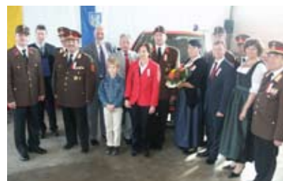
130-Jahr Feier der FF Sieghartskirchen mit Fahrzeugsegnung am 4.10.

Weitere Details zu heimatkundlichen Informationen entnehmen Sie bitte der Homepage www.sieghartskirchen.gv.at bzw. steht Ihnen Hr. Bohnec unter der Tel. Nr.: 02274/5005-25 zur Verfügung.