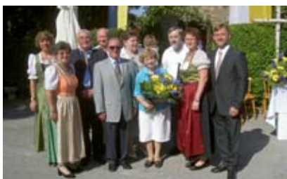
Am 16.08. wurde 40 Jahre Kapelle in Weinzierl gefeiert.