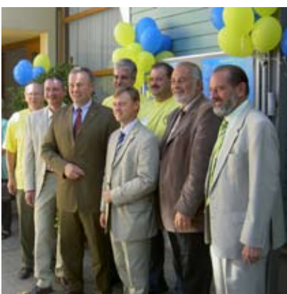
Am 23. und 24.09. fand die Gewerbeausstellung „Traumwerkstatt“ im Kulturpavillon statt.