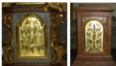
Hauptaltar - Seitenkapelle