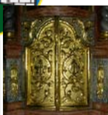
Hauptaltar - Seitenaltar (Ostern)