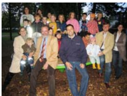
NUR INTAKTE SPIELGERÄTE MACHEN DEN KINDERN SPASS!