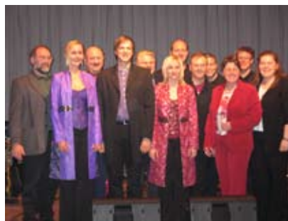
Am 03.12. eröffnete „Sound of Christmas“ die besinnliche Adventzeit.